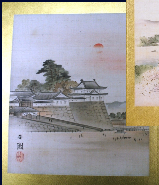
金城朝暉 西山芳園 画 Osaka Castle