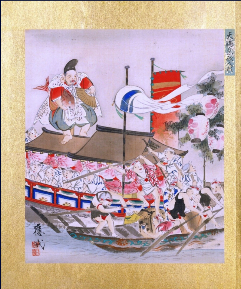
天満祭船人形 應成画 Tenjin Festival