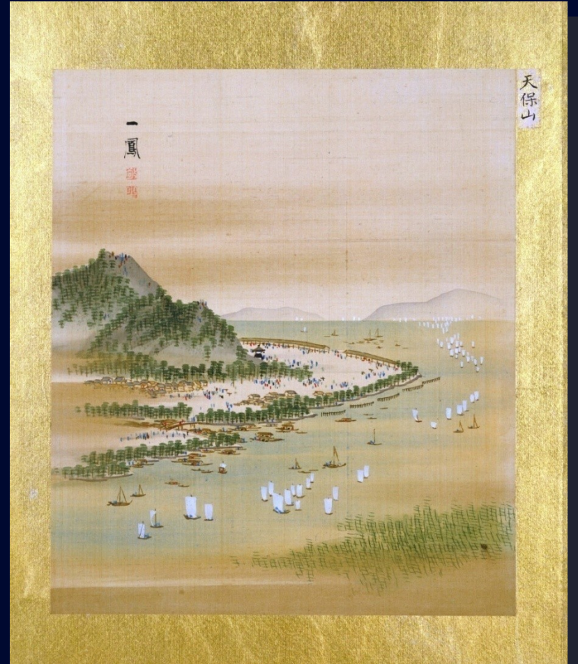
天保山 森一鳳画 Mount Tenpō