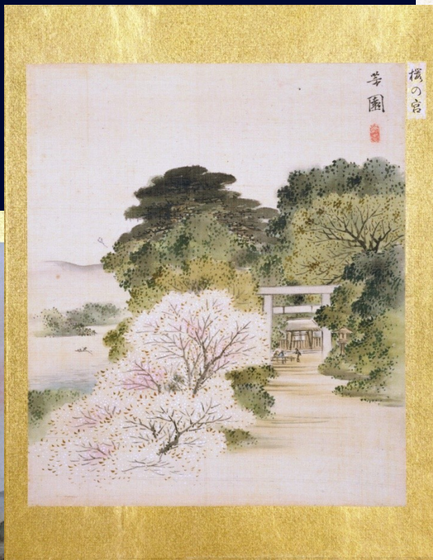
桜の宮 西山芳園 画 Sakuranomiya