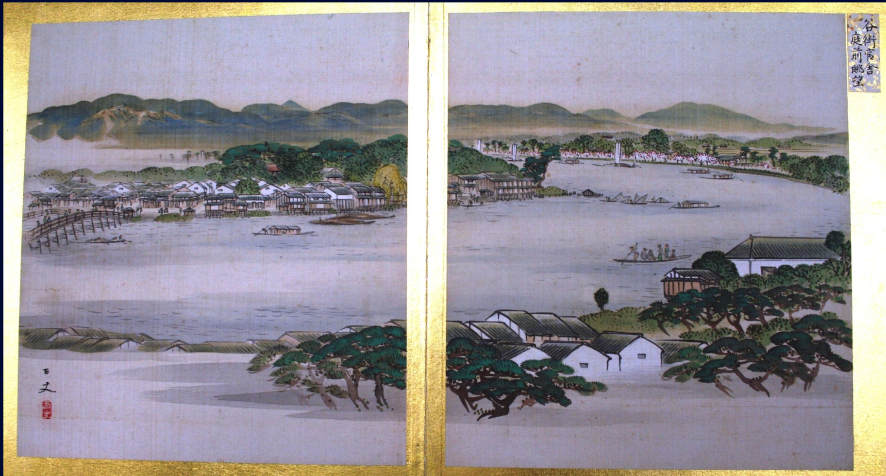
View from the Garden of the Official Residence 谷街官舎 庭前眺望 百裏画