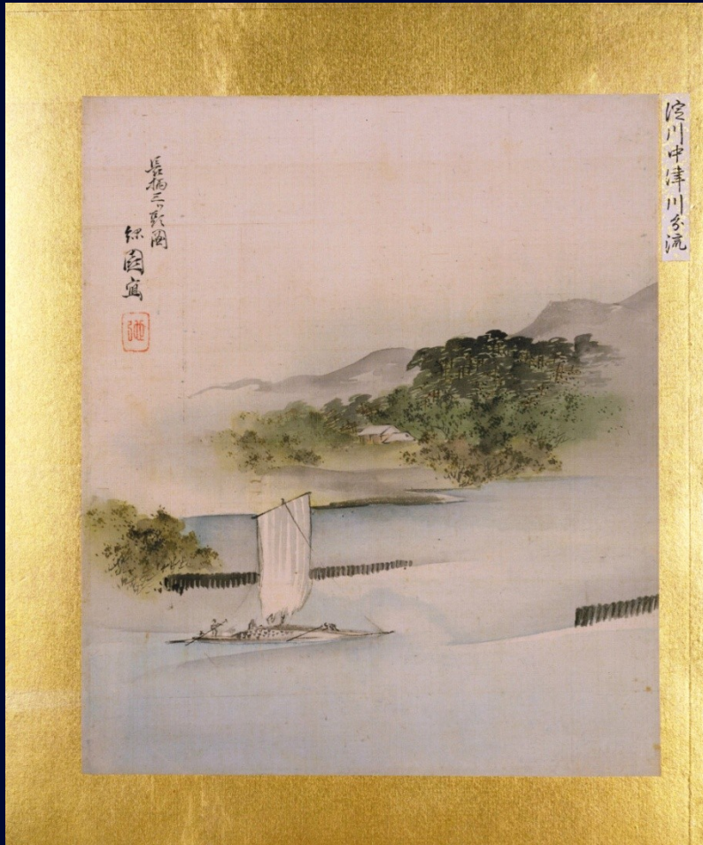
淀川中津川分流 逸見 緑園 画

The Nakatsu River, the distributary of the Yodo River