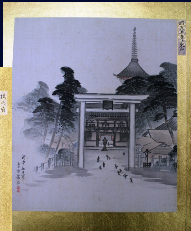
四天王寺東門（西門） 藪長水 画 Shitennō-ji