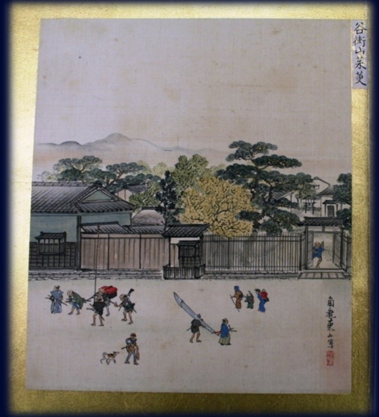
谷街山菜菓 石垣東山画 Corni fructus in Tani-machi (from Naniwa Shōgai Chō )

Collection of the Historiographical Institute, University of Tokyo