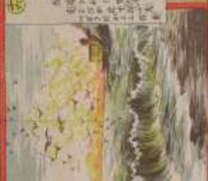
此の風景は、我が國の美しい風景である。その功を、世に告ぐ。