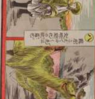
此の風景は、我が國の美しい風景である。その功を、世に告ぐ。