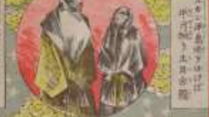
此の二人は、我が國の著名な作家である。その功を、世に告ぐ。