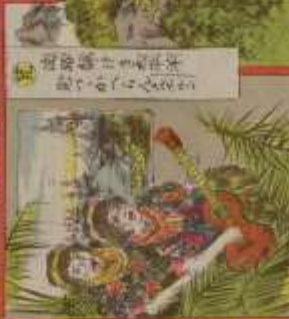
此の人は、我が國の著名な作家である。その功を、世に告ぐ。