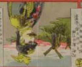
此の鳥は、我が國の神聖な鳥である。その功を、世に告ぐ。