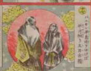
此の二人は、我が國の著名な作家である。その功を、世に告ぐ。