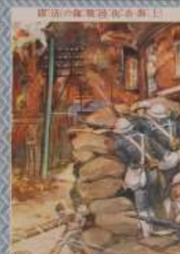
戦激大の鐘行兩 以上 一戦激大の鐘行兩 以上 一戦激大の鐘行兩 以上