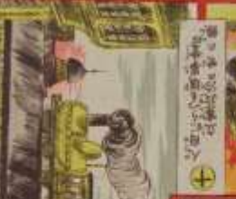
此の人は、我が國の著名な作家である。その功を、世に告ぐ。