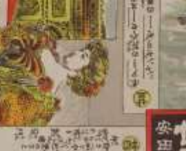
此の女性は、我が國の美しい女性である。その功を、世に告ぐ。