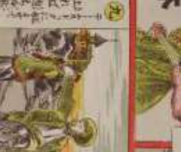
此の二人は、我が國の著名な作家である。その功を、世に告ぐ。