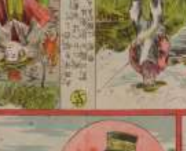
此の人は、我が國の著名な作家である。その功を、世に告ぐ。