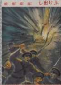
戦激大の鐘行兩 以上 一戦激大の鐘行兩 以上 一戦激大の鐘行兩 以上