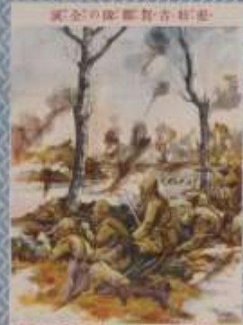
戦激大の鐘行兩 以上 一戦激大の鐘行兩 以上 一戦激大の鐘行兩 以上