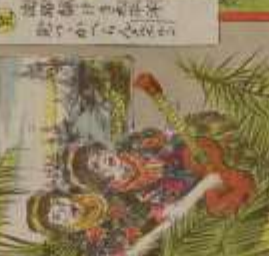
此の人は、我が國の著名な作家である。その功を、世に告ぐ。