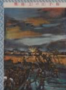
戦激大の鐘行兩 以上 一戦激大の鐘行兩 以上 一戦激大の鐘行兩 以上