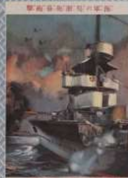
戦激大の鐘行兩 以上 一戦激大の鐘行兩 以上 一戦激大の鐘行兩 以上