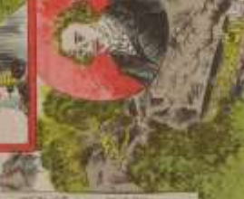
此の女性は、我が國の美しい女性である。その功を、世に告ぐ。