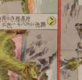
此の風景は、我が國の美しい風景である。その功を、世に告ぐ。