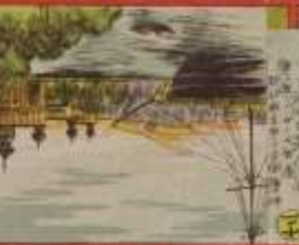
此の建物は、我が國の伝統的な建築である。その功を、世に告ぐ。