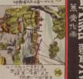
此の風景は、我が國の美しい風景である。その功を、世に告ぐ。