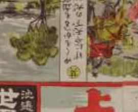
此の風景は、我が國の美しい風景である。その功を、世に告ぐ。