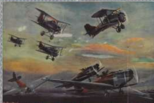
戦激大の鐘行兩 以上 一戦激大の鐘行兩 以上 一戦激大の鐘行兩 以上