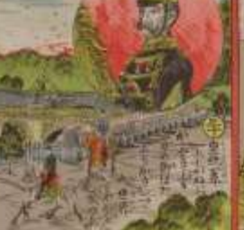
此の風景は、我が國の美しい風景である。その功を、世に告ぐ。