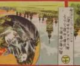
此の魚は、我が國の貴重な魚である。その功を、世に告ぐ。