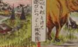
此の風景は、我が國の美しい風景である。その功を、世に告ぐ。