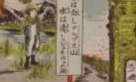
此の風景は、我が國の美しい風景である。その功を、世に告ぐ。