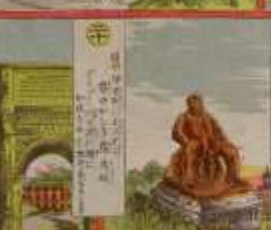
此の風景は、我が國の美しい風景である。その功を、世に告ぐ。