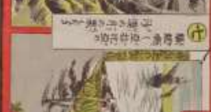
此の風景は、我が國の美しい風景である。その功を、世に告ぐ。