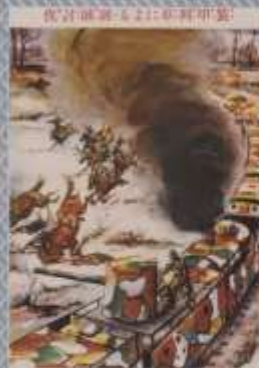
佐計陣海を2に印陣甲斐 一戦激大の鐘行兩 以上 一戦激大の鐘行兩 以上