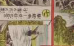
此の風景は、我が國の美しい風景である。その功を、世に告ぐ。