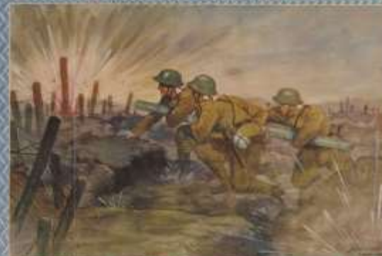
戦激大の鐘行兩 以上 一戦激大の鐘行兩 以上 一戦激大の鐘行兩 以上