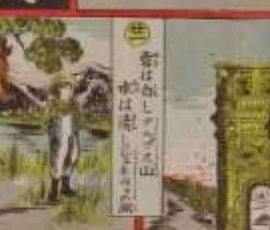
此の風景は、我が國の美しい風景である。その功を、世に告ぐ。