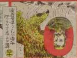
此の歌謡は、我が國の歌謡界に、新しい風を吹かせた。その功を、世に告ぐ。