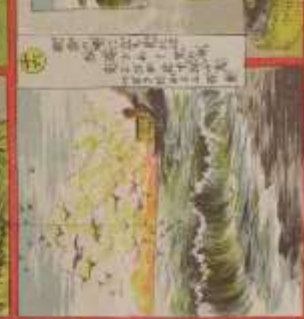
此の風景は、我が國の美しい風景である。その功を、世に告ぐ。