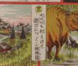
此の風景は、我が國の美しい風景である。その功を、世に告ぐ。