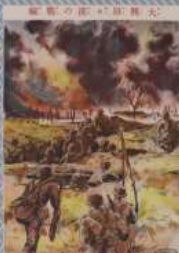
戦激大の鐘行兩 以上 一戦激大の鐘行兩 以上 一戦激大の鐘行兩 以上