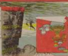
此の旗は、我が國の獨立のシンボルである。その功を、世に告ぐ。