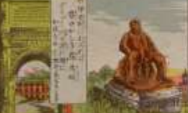
此の風景は、我が國の美しい風景である。その功を、世に告ぐ。