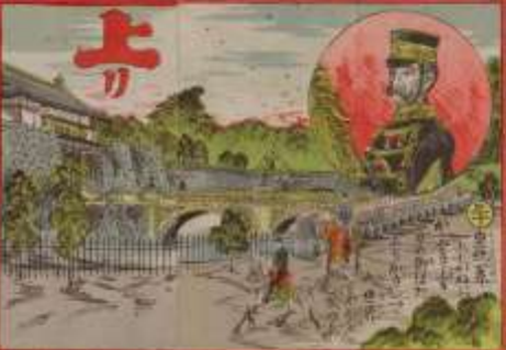
此の橋は、我が國の有名な橋である。その功を、世に告ぐ。