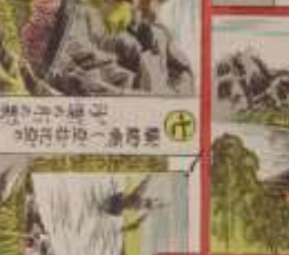
此の風景は、我が國の美しい風景である。その功を、世に告ぐ。