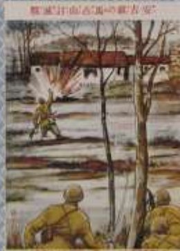
戦激大の鐘行兩 以上 一戦激大の鐘行兩 以上 一戦激大の鐘行兩 以上